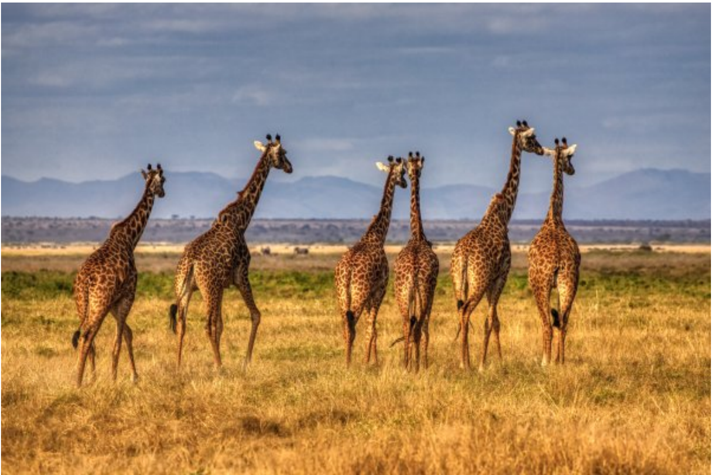
Žirafy – ohrožený druh na pokraji vymření.

Woody je totiž tulák a podobně jako mnoho mladíků své doby, často spíš ještě dětí, se jím stal nedobrovolně, když během texaských prachových bouří ve třicátých letech přišel o rodinu i domov. Navíc se svět stále potýkal s následky Velké hospodářské krize. A tak mu nezbylo než s holým zadkem sednout na vlak a zkusit štěstí někde jinde, nějak jinak. Na cestě se žirafami setkává řadu podobně bezprizorních tuláků, jejichž způsob života pro něho představuje únik od všech hrozících problémů, jakkoli zároveň vytváří řadu nových.